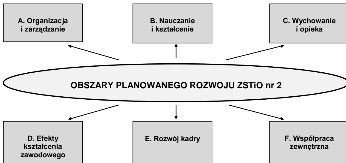
Rysunek 1 Graficzne ujęcie obszarów dalszego rozwoju ZSTiO nr 2 w Katowicach

umożliwiła sprawne organizowanie, koordynowanie i nadzorowanie zadań, przypisanych do sześciu obszarów rozwoju (rys. 2).